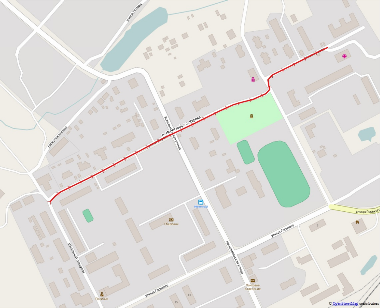
Схема расположения: п. Монетный, ул. Кирова